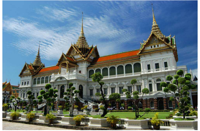
Palau reial a Bangkok (Tailàndia)