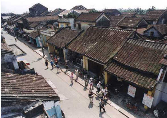
Hoi An (Vietnam)