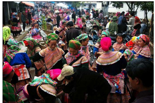
Mercat de Bac Ha (Vietnam)