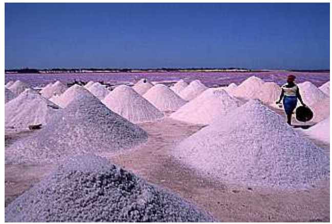
Extracció de Sal al Ilac Rosa, Dakar