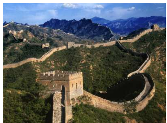
Gran Muralla xinesa- Rodalies de Pekin (Xina)