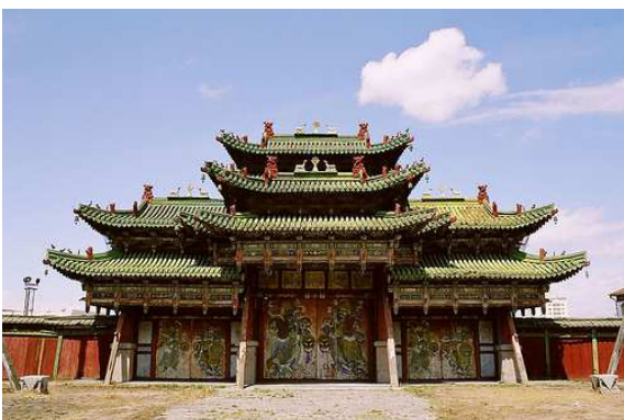
Palau d'estiu- Ulan Bator (Mongòlia)