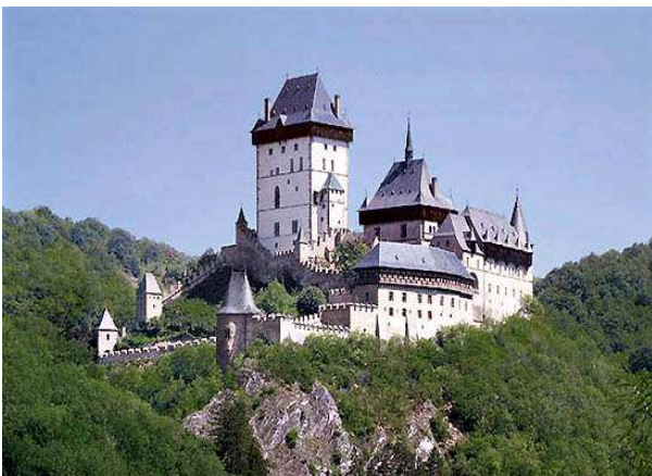
Castell de Karljstein