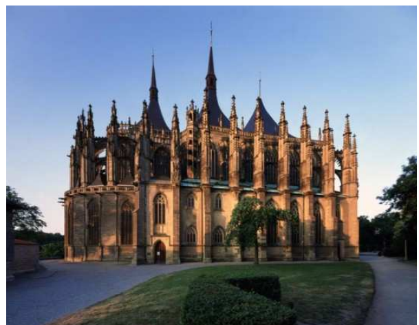
Catedral de Kutná Hora