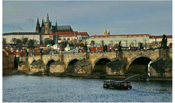
Praga- Pont de Carles amb el castell al fons