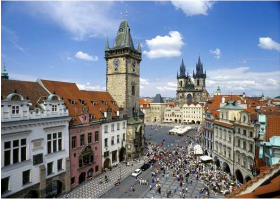
Praga- Plaça vella