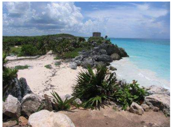
Platja a Tulum