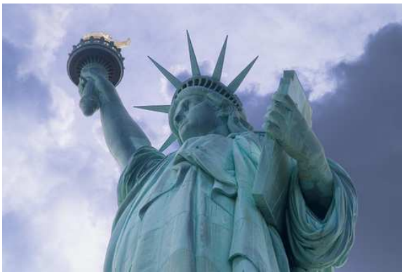
Estàtua de la llibertat