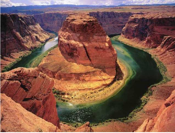
Grand Canyon (Arizona)