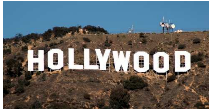
Los Ángeles (Hollywood)