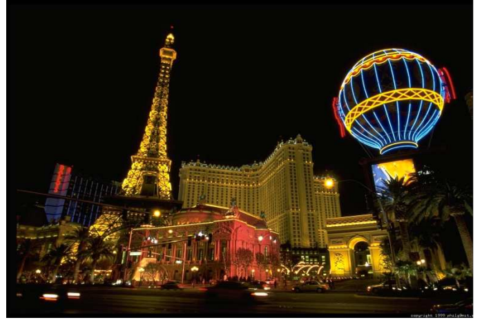
Las Vegas (Nevada)