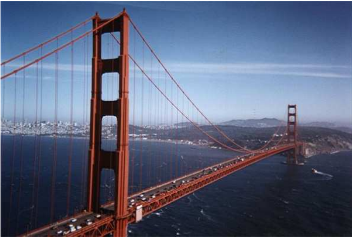
San Francisco (Califòrnia)