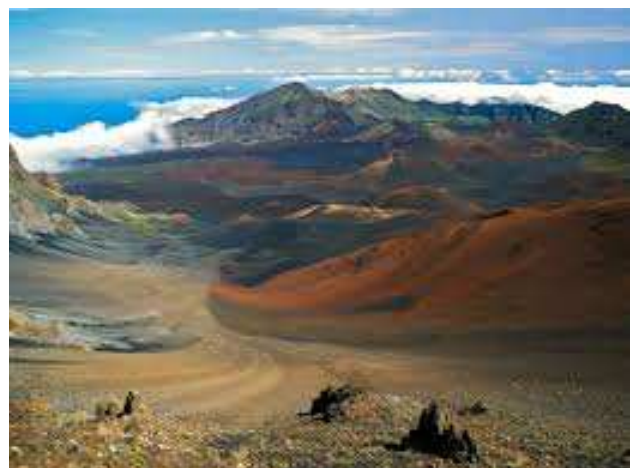
Paisatge volcànic a Maui