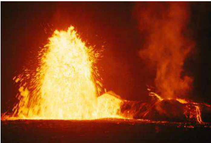
Volcà a l'illa de Gran Hawaii