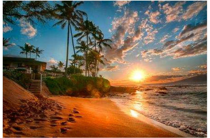
Illa de Gran Hawaii