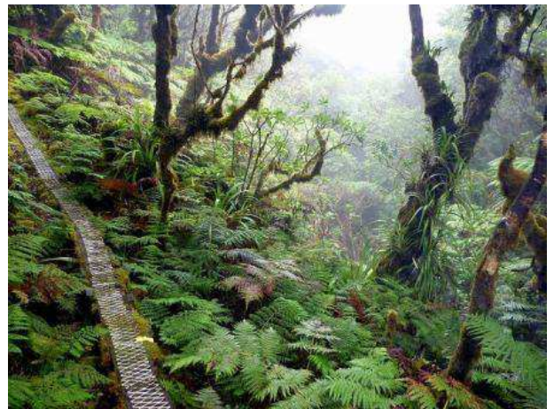
Senderisme per Molokai