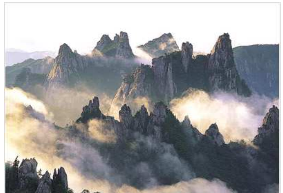
Parc Nacional de Seoraksan