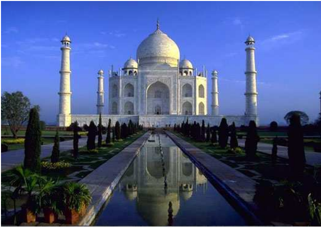
Taj mahat (Agra)