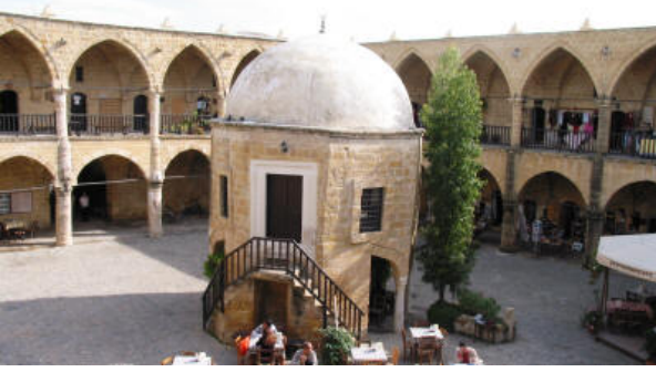
Buyuk Han, Nicòsia