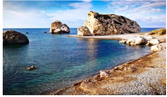
Petra tou Romiou