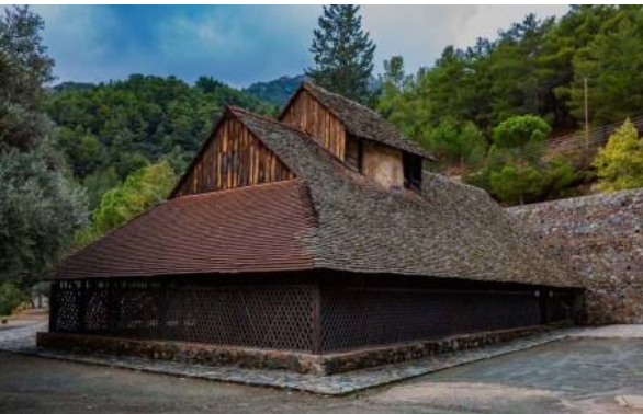
Panagia tou Araka