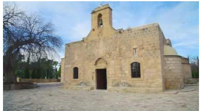
Església d'Angeloktistos a Kiti