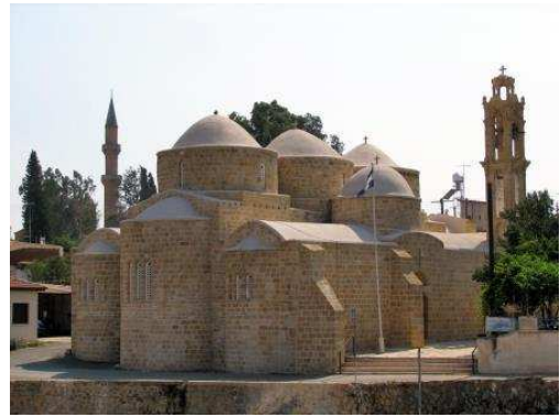
Sant Barnabàs a Peristerona