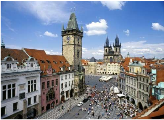
Praga- Plaça vella