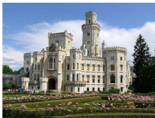
Hluboká nad Vltavou