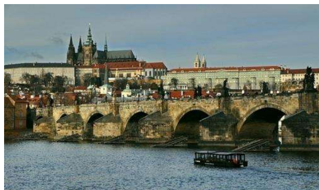
Praga- Pont de Carles amb el castell al fons