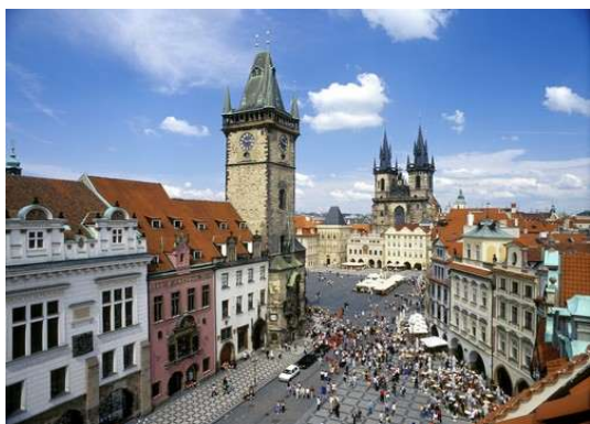
Praga- Plaça vella