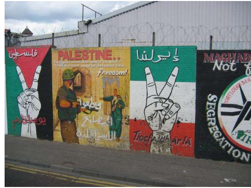
Murals a Belfast oest