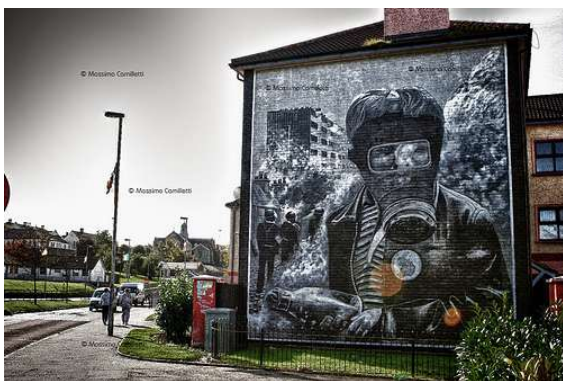
Murals a Derry