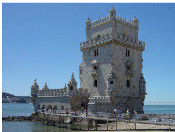
Torre de Betlem