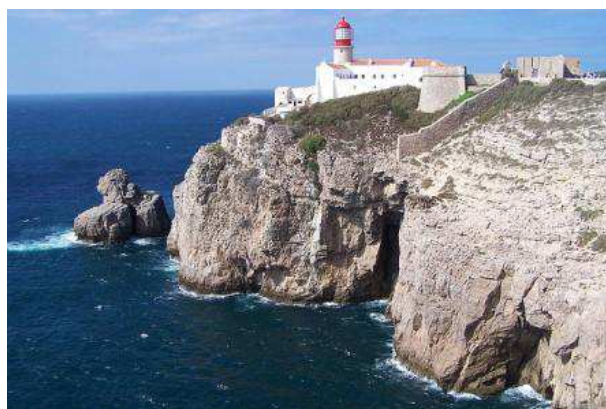
Cap de San Vicente, Sastres (Algarve)