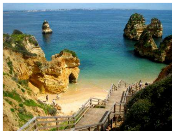
Platja prop de Lagos, Algarve