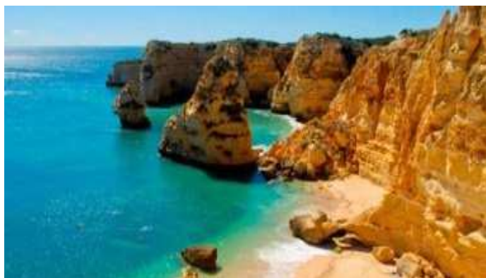
Platja prop d'Albufeira, algarve