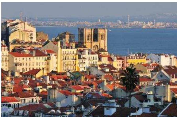
Lisboa, Sé i casc antic