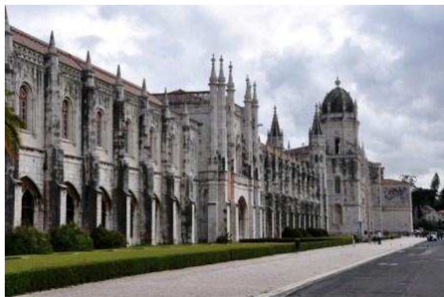
Monastir dels Jerónimos