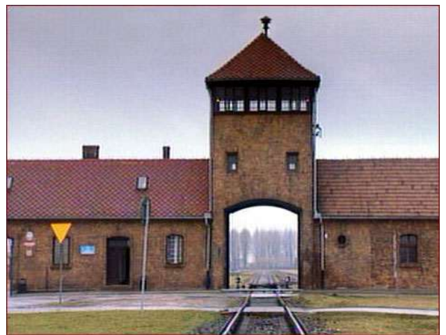
Canp de concentració d'Auschwitz