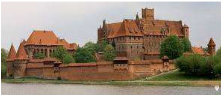
Castell de Malbork