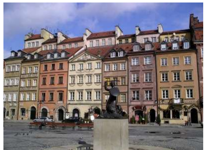
Varsòvia (Plaça del mercat)