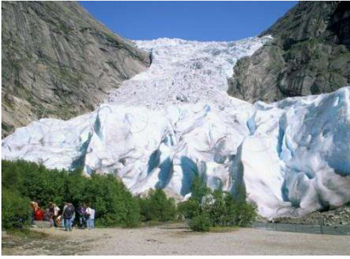
Glacera de Briksdal