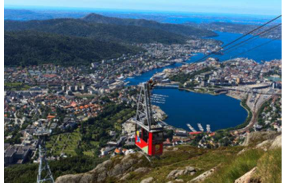
Bergen, des de l'aire