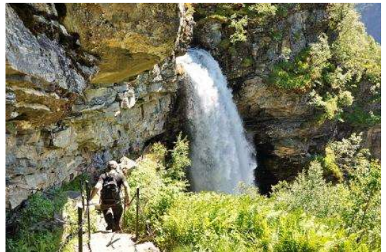
Cascada de Storseter