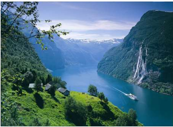
Fiord de Geiranger