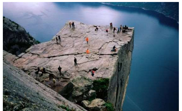
Roca "El púlpit" a Stavanger