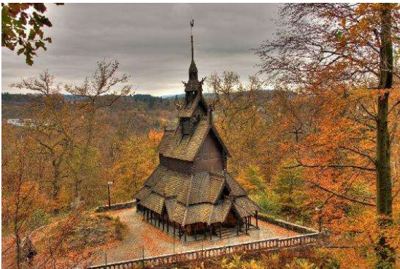
Església típica Noruega