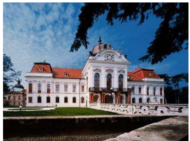
Palau de Gödöllő