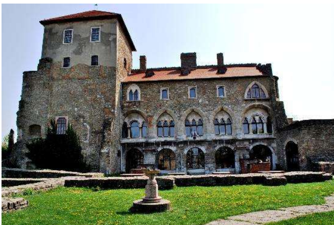
Castell de Tata