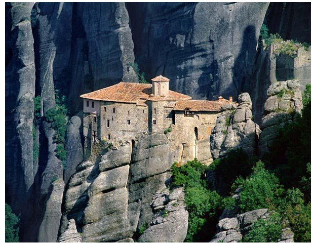
Monestirs de Meteora