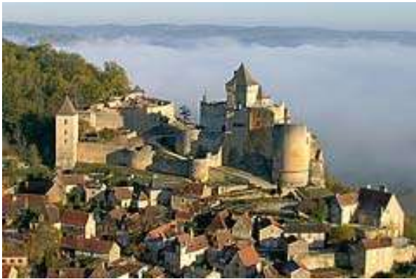
Castell de Castelnaud