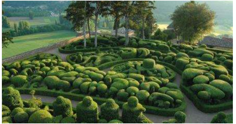
Jardins de Marqueyssac