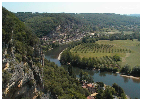
Vistes del riu Dordonya