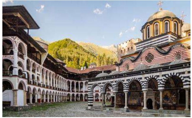
Monastir de Rila