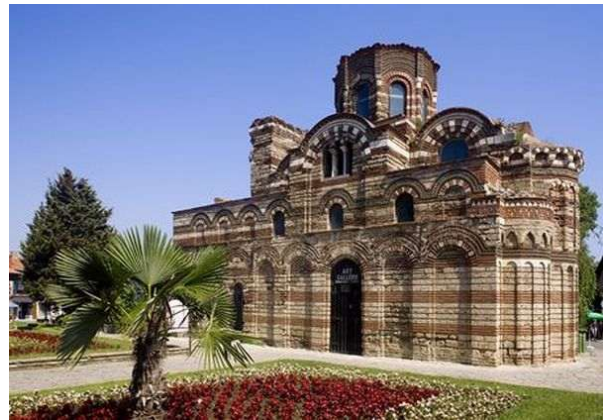
Església medieval a Nesebar