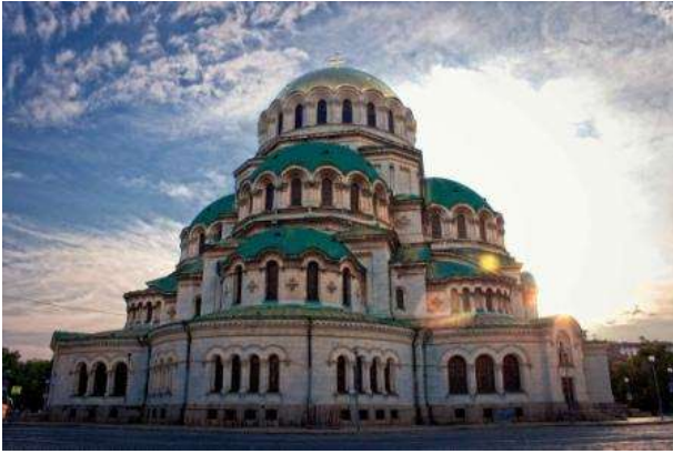
Catedral de Sofia