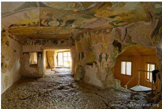
Esglésies rupestres a Ivanovo