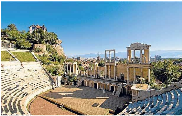
Teatre romà de Plovdiv