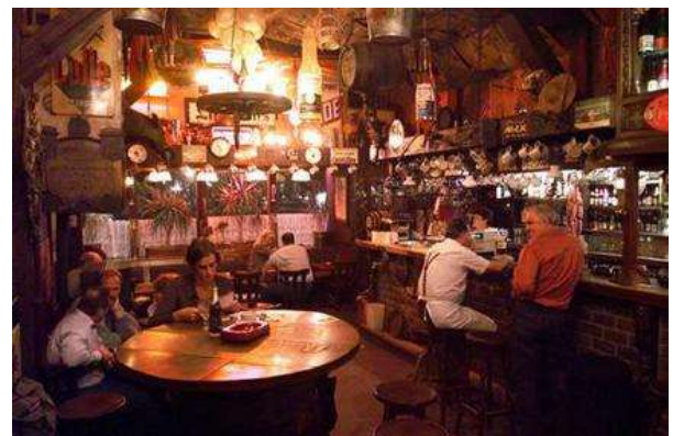
Pub a Gant (Dulle Griet)