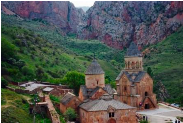
Monestir i gorges de Noravank