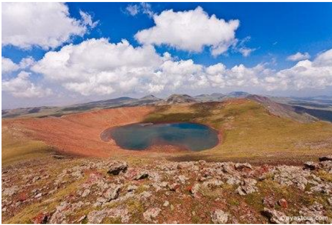
Cràter del mont Azhdahak