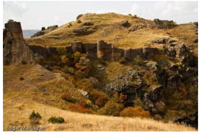
Fortalesa de Kakavaberd