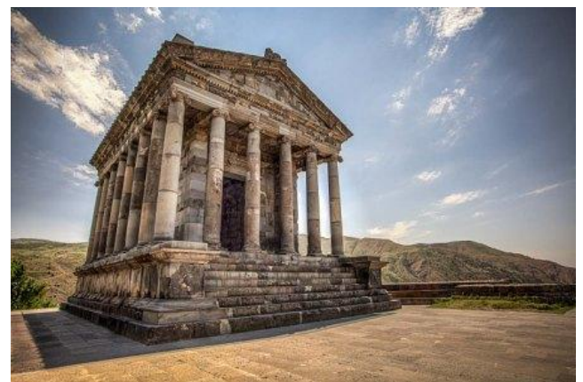
Temple de Garni