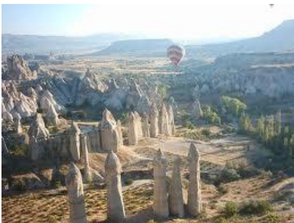
Paisatge de la Capadòcia