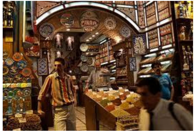
Istanbul (Gran Basar)