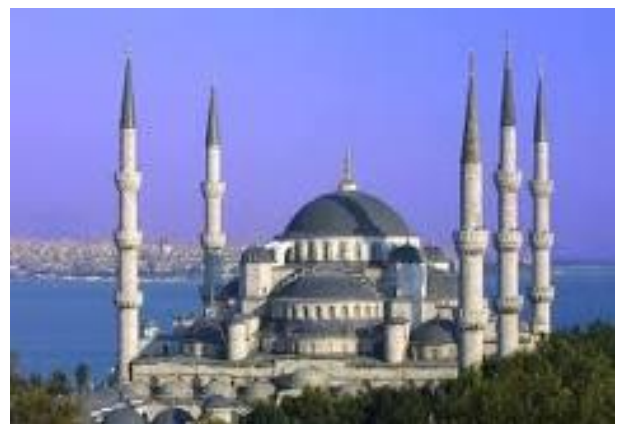
Mesquita blava (Istanbul)