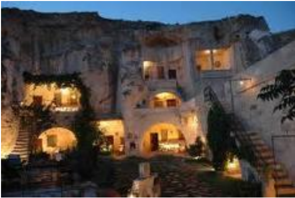
Vivendes a la Capadòcia