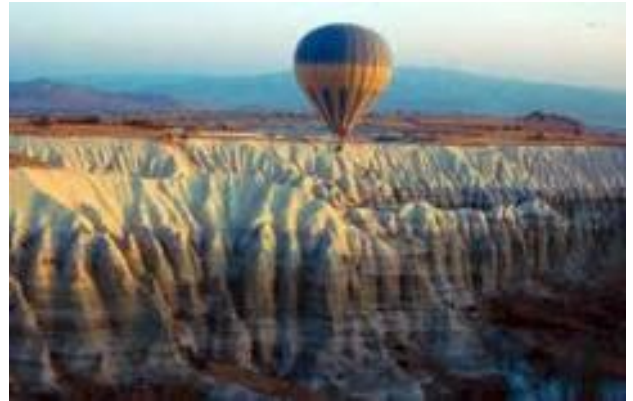
Viatge en globus per la Capadòcia