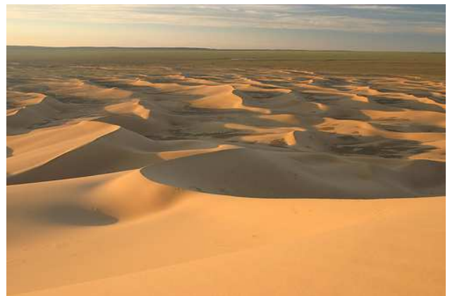
Dunes de Khongor (desert del Gobi)