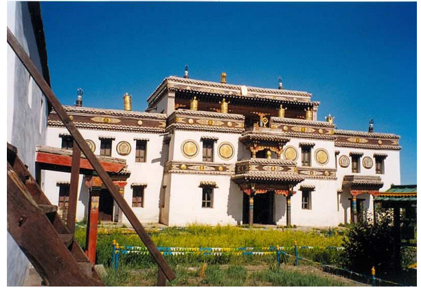
Monestir Erden Zuu