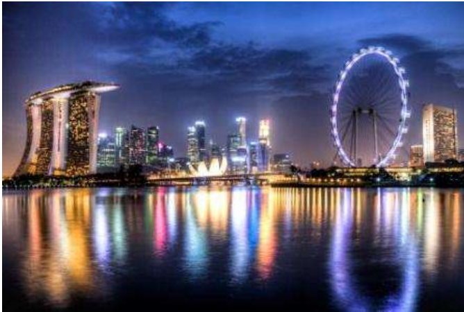
Singapur: Marina Bay, Flyer i skyline