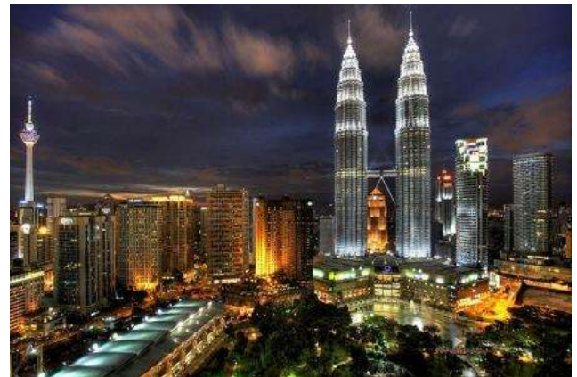
Torres Petrones i skyline a Kuala Lumpur