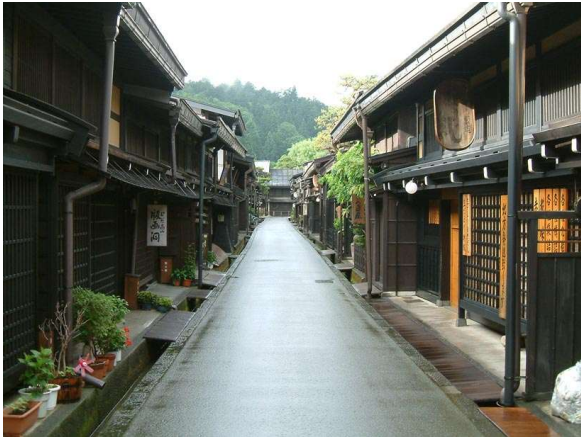
Barri tradicional de Takayama