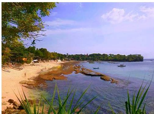
Mushroom beach, Nusa Lembongan