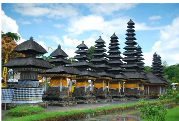
Taman Ayun, Patrimoni Mundia