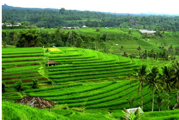
Arrossars a Jatilawit