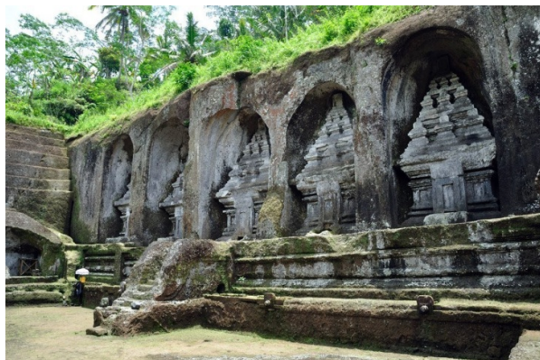
Gunung Kawi, Patrimoni Mundial