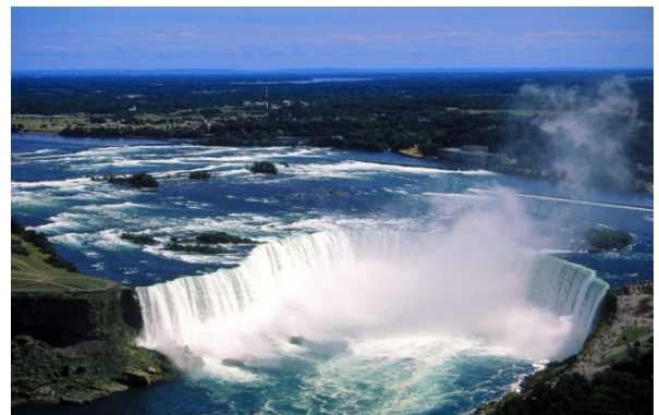
Catarates del Niagara