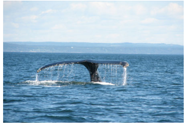
Balenes a Tadoussac