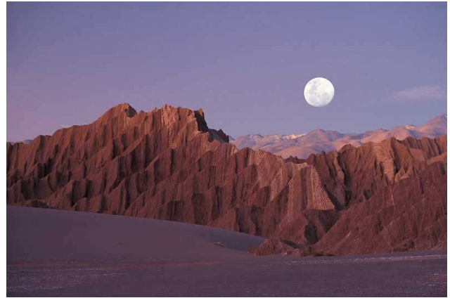
Valle de la Luna (Atacama)