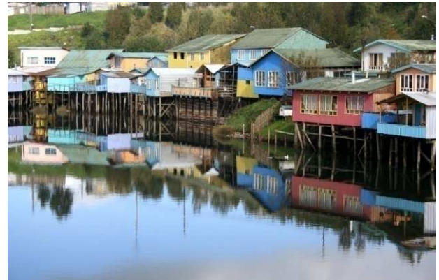
Palafits a Chiloé