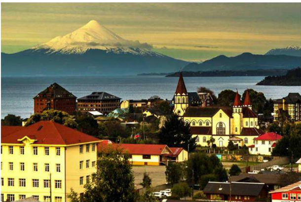
Puerto Varas, Ilac Llanquihue i volcà Osorno