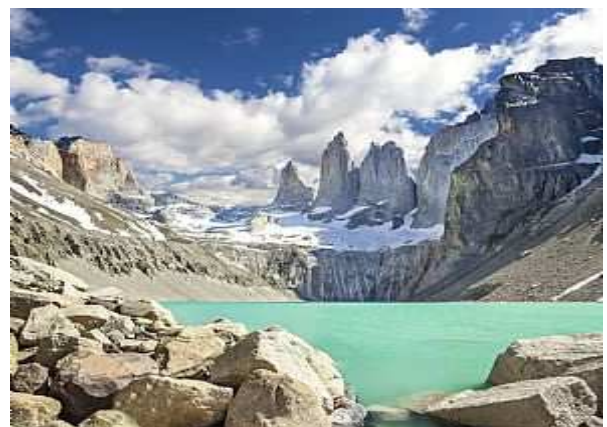
PN Torres del Paine (Puerto Natales)