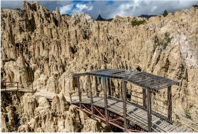
Valle de la Luna, La Paz , Bolivia