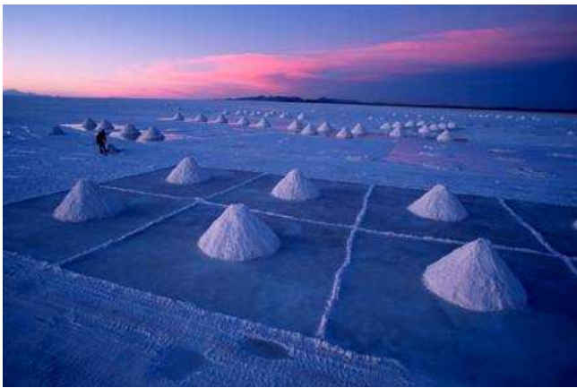
Gran Salar Uyuni