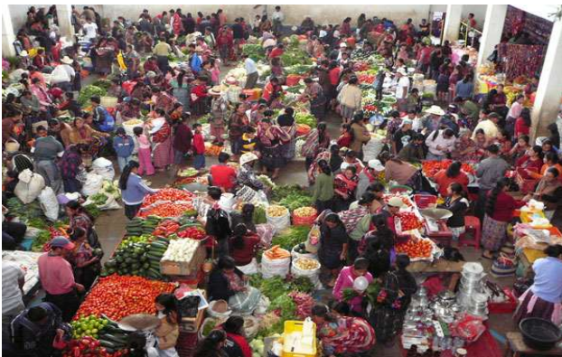
Mercat de Chichicastenango