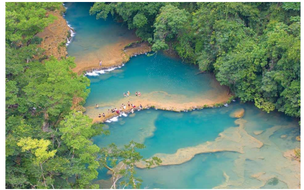
Cascadas de Semuc Champey