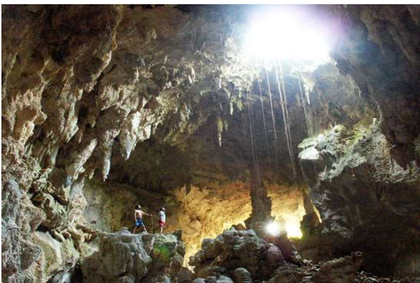
Coves de Candelaria