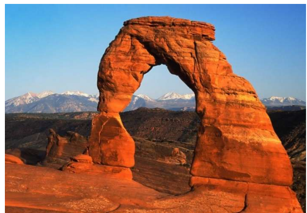
Arches National Park (Utah)