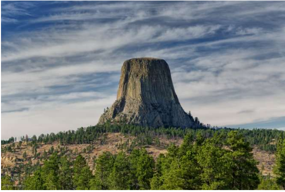
Devils Tower (Wyoming)