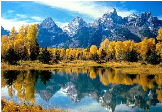
Grand Teton National Park (Wyoming)