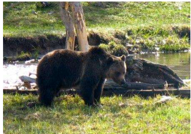
Óssos a Yellowstone (Wyoming)