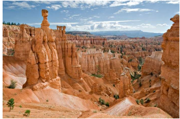
Bryce Canyon (Utah)