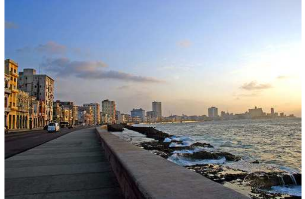
Malecón a La Habana