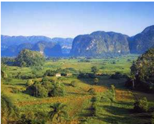
Valle de Viñales