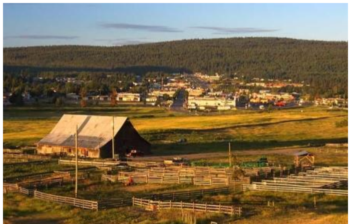
100 Mile house, British Columbia