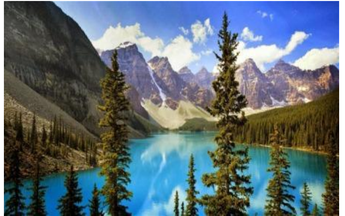
Banff National Park, Alberta