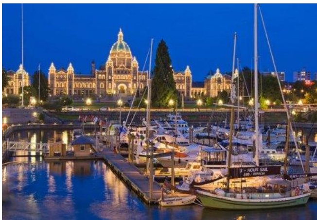
Victoria, British Columbia