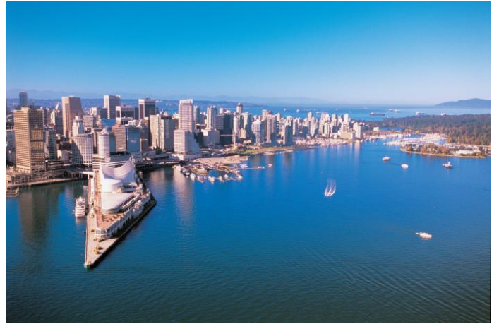
Vancouver (British Columbia)