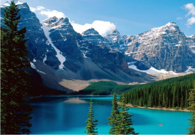
Lake Louise, Alberta