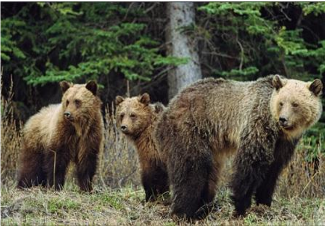
Óssos grizzlys, Jasper National Park; Alberta