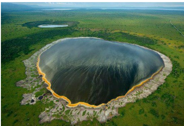
Llacs volcànics bessons a Queen Elisabeth NP