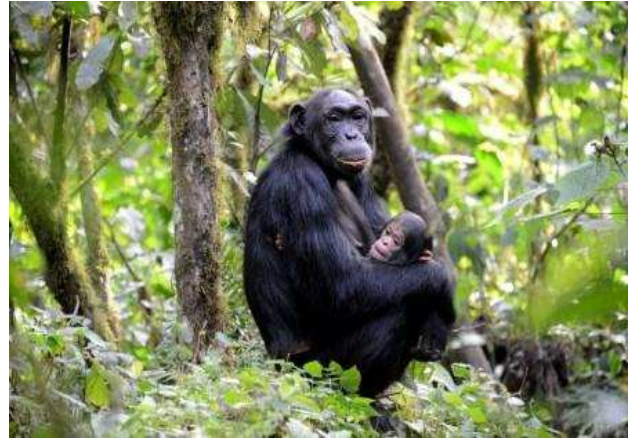
Kibale National park