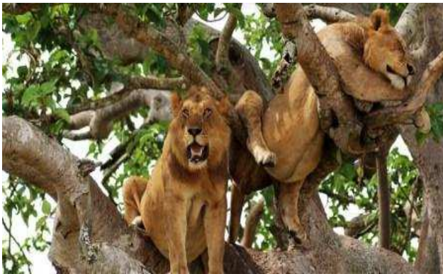
Lleons grimpadors a Queen Elisabeth NP