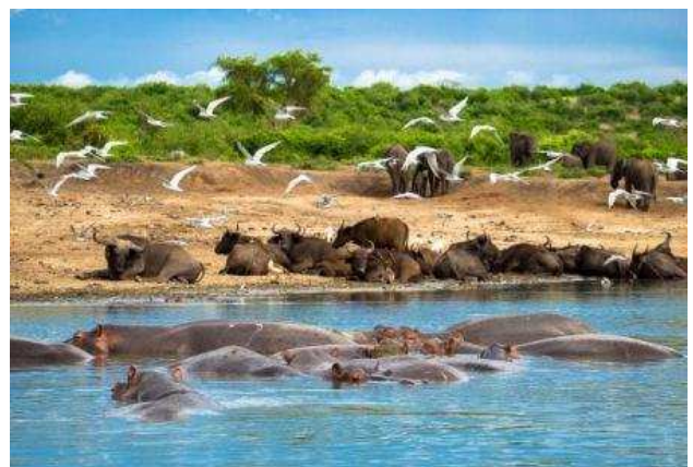
Canal de Kazinga