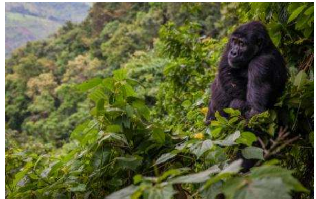
Bosc impenetrable de Bwindi