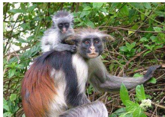
Fauna de Zanzibar