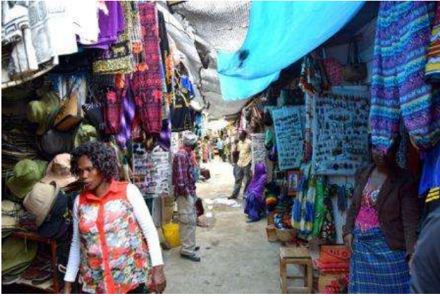
Arusha Masai market