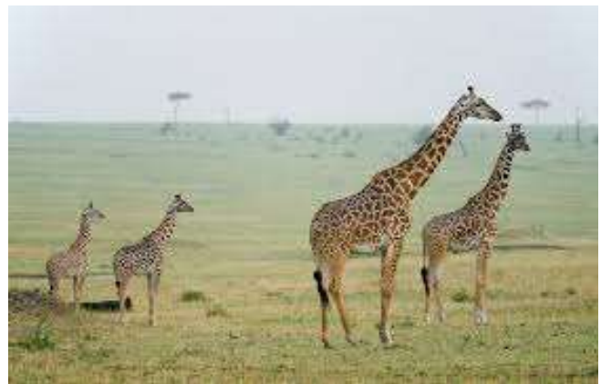
Serengeti National Park