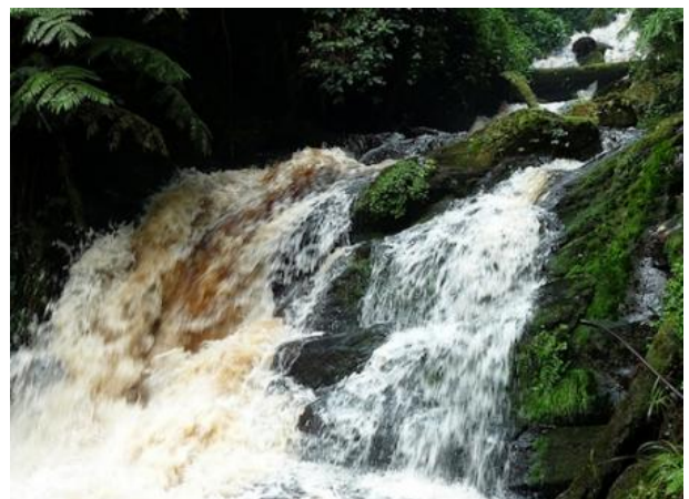
Isumo waterfalls a Nyungwe forest