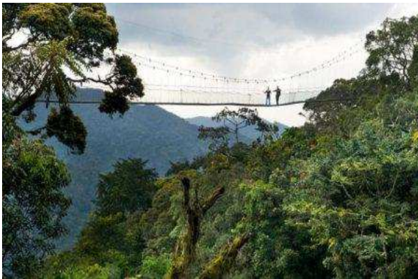
Canopy at Nyungwe Forest National Park