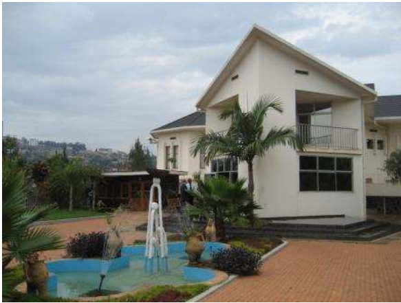
Gisozi Genocide Memorial