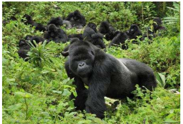
Nyungwe Forest i Volcanoes National Park