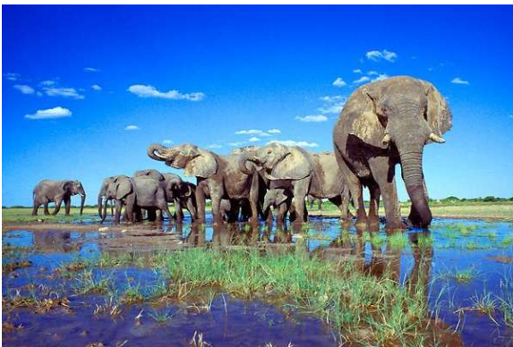
Etosha National park