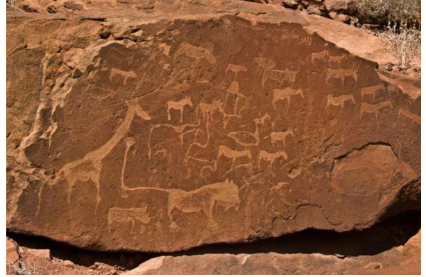
Gravats a Twyfelfontein, Damaraland