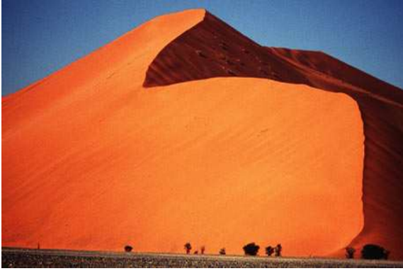
Desert del Namib, Namíbia