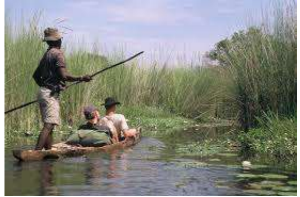
Franja de Caprivi