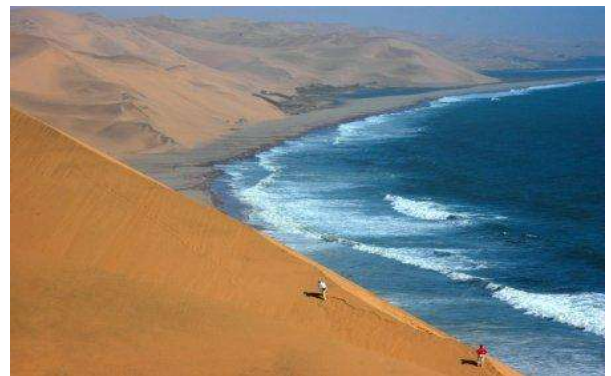
Sandwich harbour, Namíbia