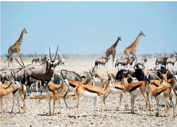
Etosha National Park, Namíbia