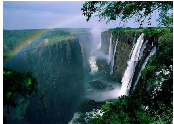
Victoria Falls, Zimbàbue