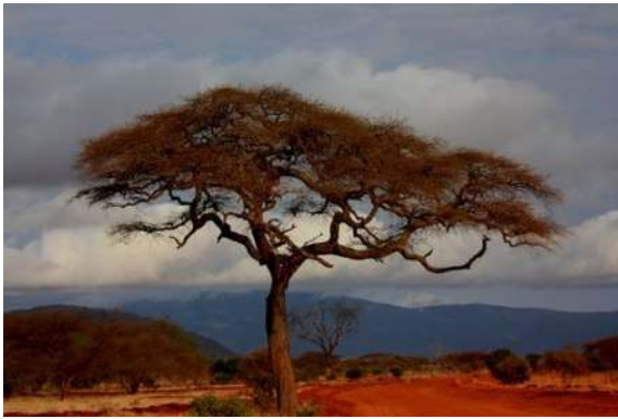
Acàcia a la sabana