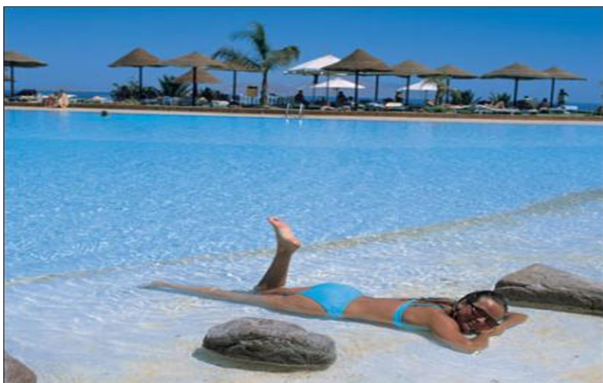
Relax en Hurgada