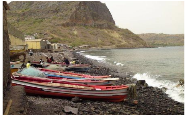
Ribeira da Barca