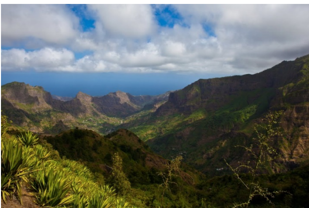
Parc Natural de Rui Vaz