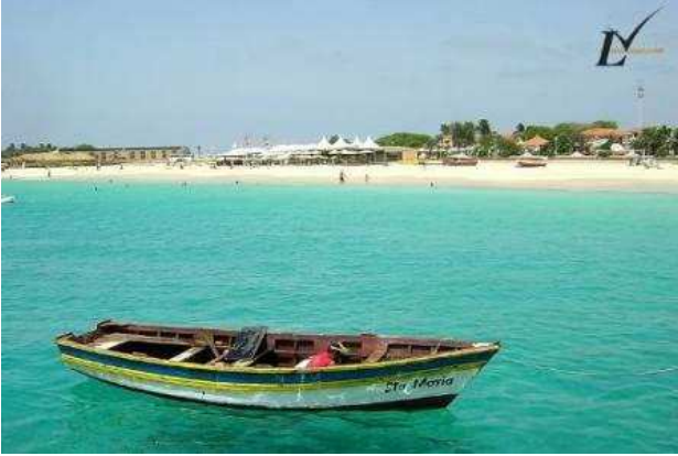
Platges de Maio