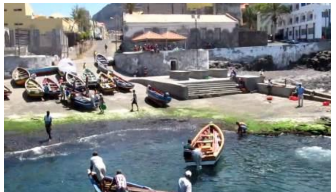
Ponta do Sol