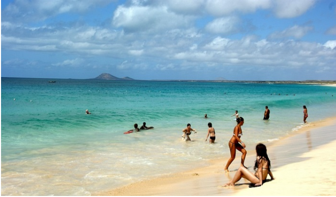
Platges de Sal