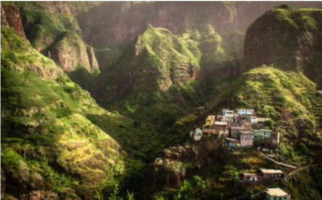
Vall de Paul