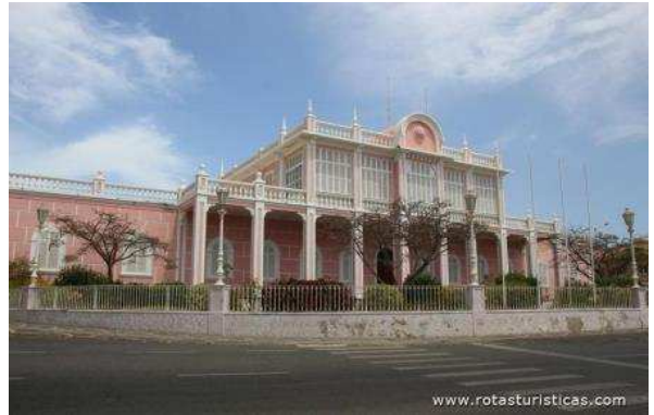
Palau del governador a Mindelo