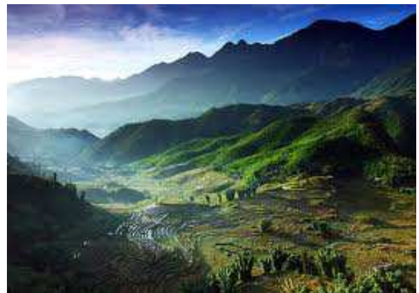
Valle de sapa (Vietnam)