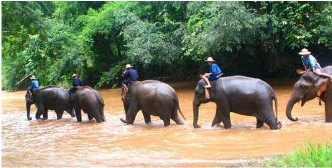
Chian Rai (Tailandia)