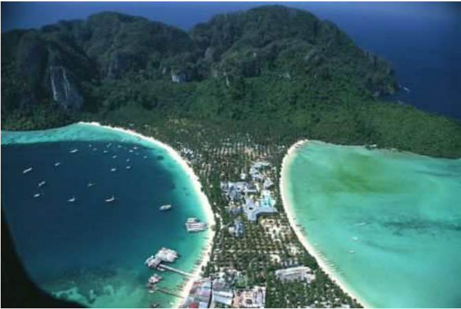
Playas de Krabi (Tailandia)