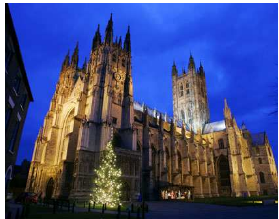
Catedral de Canterbury