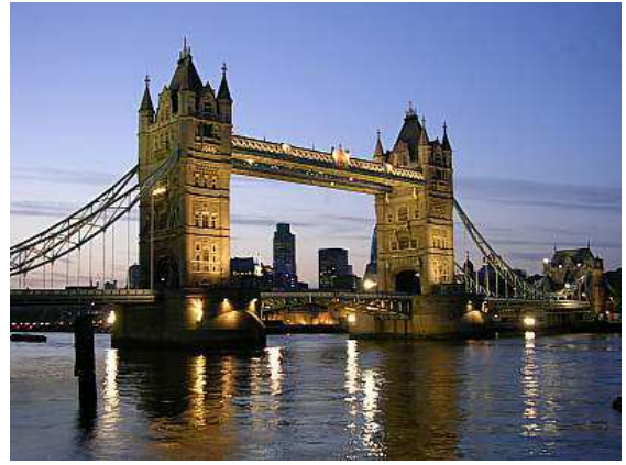
Londres: Puente de la torre