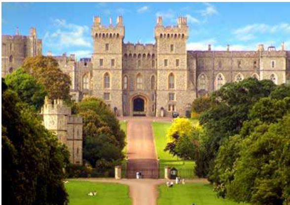
Castillo de Windsor