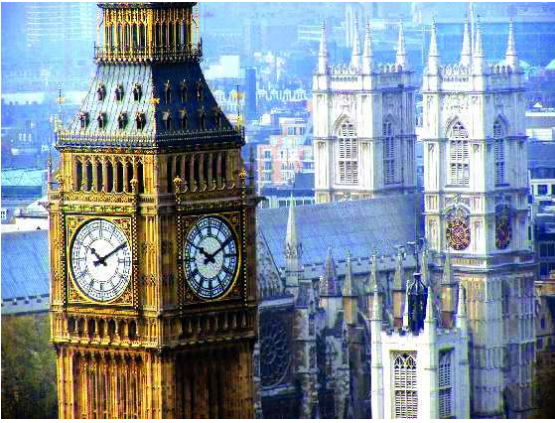
Londres: Big ben y abadia de Westminster