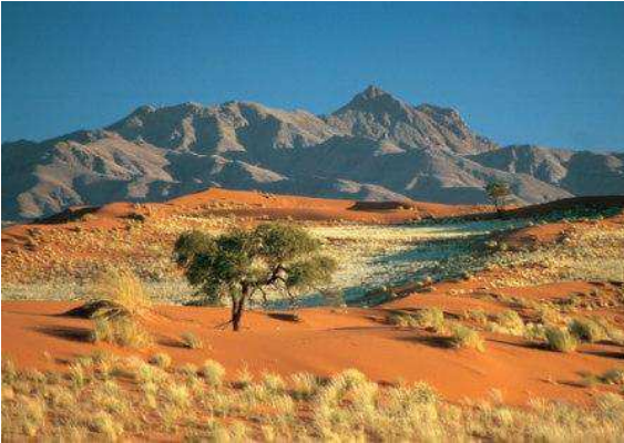
Desierto del kalahari