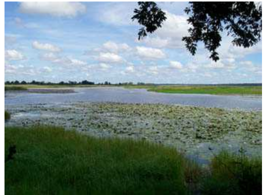
Reserva de caza de Mahango