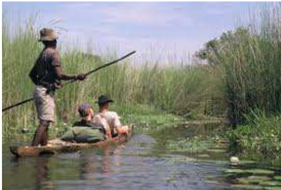
Mokoro por los canales del delta d'Okavando