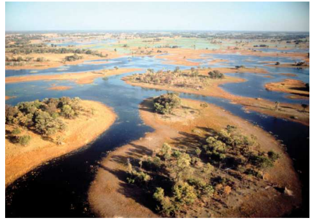
Delta del Okavango