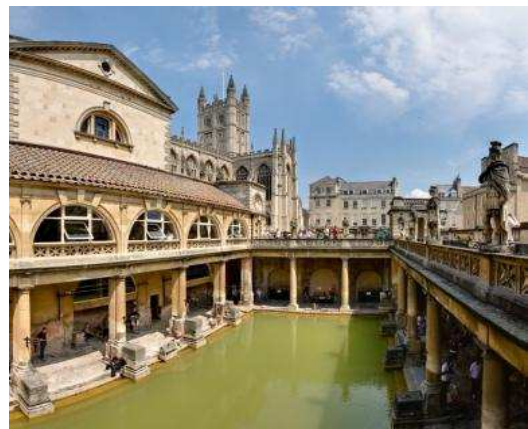
Baños romanos en Bath