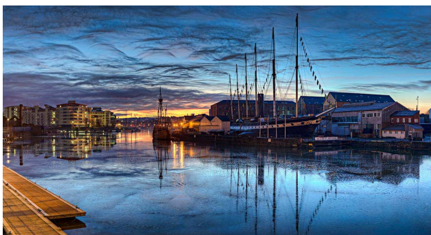
Puerto de Bristol