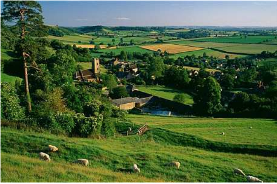
la campiña inglesa