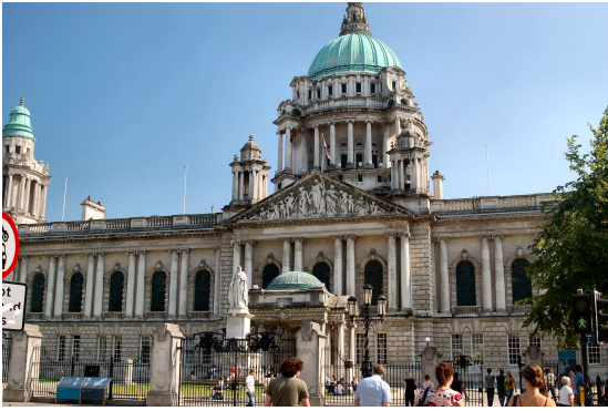
Belfast City Hall