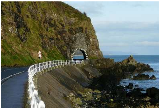
Antrim Coast Road