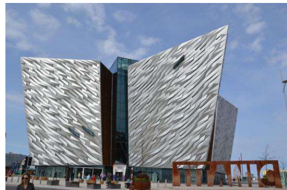
Titanic Museum, Belfast