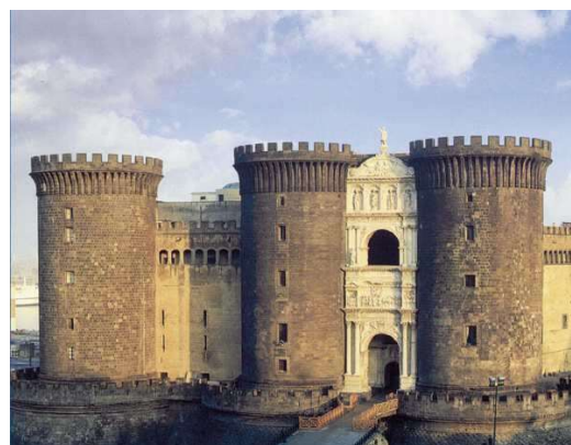
Castillo Maschio Angionio, Nápoles